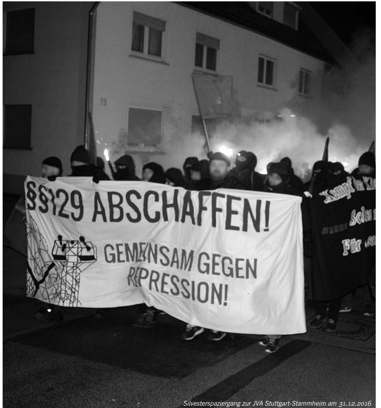
Silvesterspaziergang zur JVA Stuttgart-Stammheim am 31.12.2016

Sei es in türkischen oder in deutschen Gefängnissen: es existieren Angriffe gegen revolutionäre Gefangene mit dem Ziel, sie zur Verleugnung ihrer revolutionären Ideen zu zwingen. Der Unterschied besteht letztendlich nur in der Art und in der Häufigkeit der Praxis.“