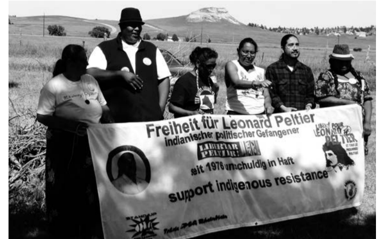
Bewohner*innen der Pine Ridge Reservation in Oglala am Commemoration Day 2013 mit einem Transpi der deutschen Support Group

Für alle fortschrittlichen Menschen in den USA wird die Woche vom 18. bis 25. Januar 2017 in mehrfacher Hinsicht in Erinnerung bleiben, denn mit dem Antritt Donald Trumps wird sich die Politik der Vereinigten Staaten in den nächsten Jahren national und international noch rücksichtsloser gegen Menschenrechte und Umweltschutz positionieren.