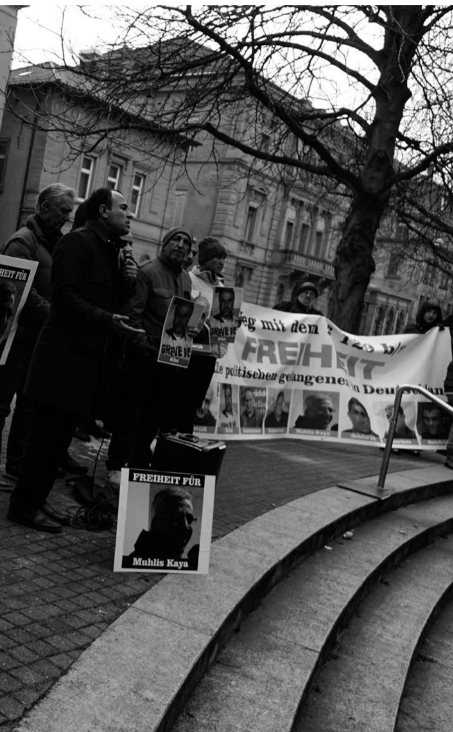
Solidaritätskundgebung vor dem OLG Stuttgart am 26.1.2017